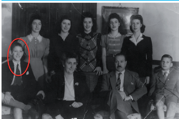
Su familia original en Resistencia: sus padres, sus cinco hermanas y su hermano