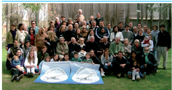
Los Beveraggi del país