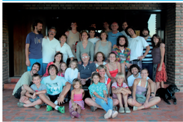
Con sus nietos en su casa de Gualeguay