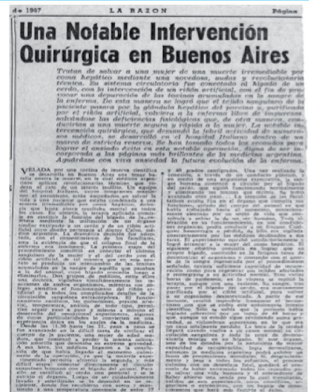
Publicación del primer caso de perfusión hepática extracorpórea del país