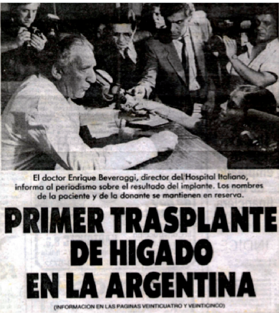
Momento en que anuncia el primer trasplante hepático en el HIBA