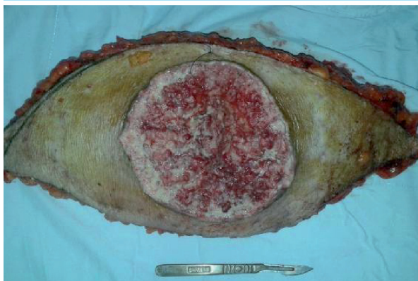
Pieza operatoria (vista anterior)

al peritoneo y, a través de restos del uraco, a la vejiga, por lo que se recomienda la resección quirúrgica de tejido subcutáneo hasta el peritoneo, tal como hemos efectuado en nuestro paciente 5 .