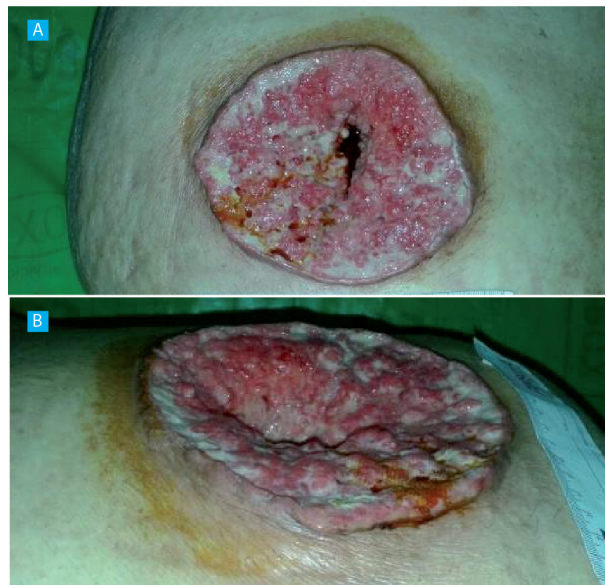
A, lesión vista de frente; B, lesión vista de perfil

Recibido el 19 de marzo de 2016 Aceptado el 30 de mayo de 2016